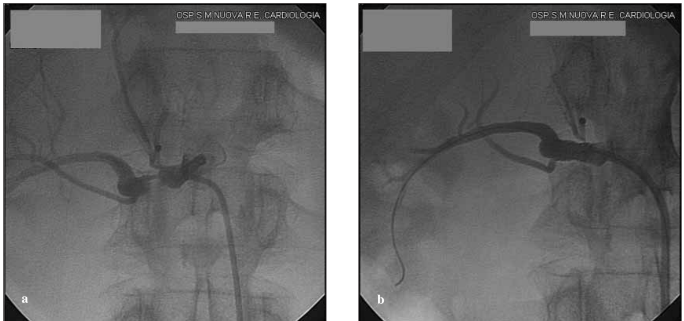
Fig. 3 - a) Angiografia renale (prima dell'angioplastica): stenosi serrata (>90%) post-ostiale dell'arteria renale dx. b) Angiografia renale (dopo angioplastica): stent ben posizionato con correzione della stenosi.

renale dx (Fig. 3b). Il contemporaneo controllo angiografico mostra corretto posizionamento dello stent con buon effetto angiografico di flusso intraparenchimale nel rene rivascularizzato. Nei giorni successivi si assiste ad incremento della diuresi ed al progressivo miglioramento degli indici ritentivi, sino a valori di creatininemia di 2.6 mg/dL. Viene pertanto sospeso il trattamento emodialitico ed il paziente viene rinviato ad un follow-up clinico-ecografico ambulatoriale. Dopo 12 mesi gli indici funzionali renali permangono sostanzialmente stazionari (creatininemia 3 mg/dL) ed il paziente è mantenuto in terapia conservativa.