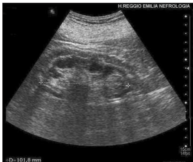
Fig. 1 - A sx: rene dx di volume ai limiti superiori (asse lungo 11.9 cm), con buon spessore parenchimale. A dx: rene sx a contorni ondulati, di 10.2 cm di asse lungo, con spessore parenchimale ridotto.