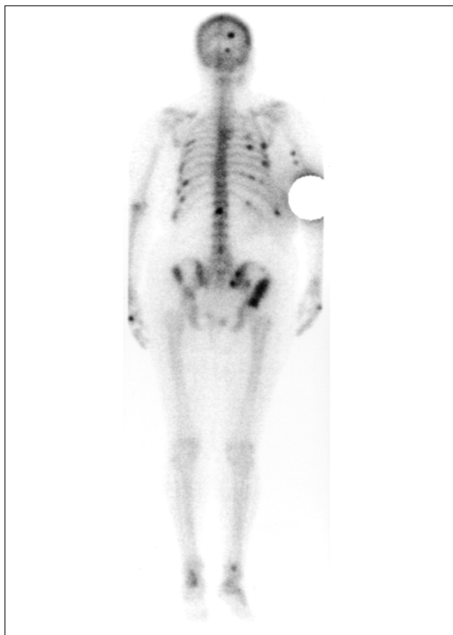
Fig. 1 - Scintigrafia ossea (Tc-99) eseguita 1 mese dopo la paratiroidectomia e tiroidectomia. Evidenti lesioni ossee secondarie diffuse.

Dopo discussione del caso con l'endocrinologo e il chirurgo, la paziente veniva sottoposta ad intervento di tiroidectomia totale e paratiroidectomia subtotala.