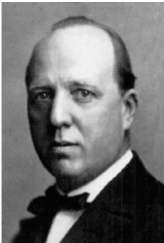
Fig. 1 - Adolfo Ferrata.

sformarsi in tutte le celle ematiche; nel 1919-1924, la descrizione dell'emoistioblasto, cellula indifferenziata totipotente di natura mesenchimale; nel 1920, la fondazione della rivista " Haematologica ", che costituisce la più antica rivista di ematologia oggi pubblicata; nel 1934, la fondazione della Società Italiana di Ematologia in collaborazione con Giovanni di Guglielmo (1886-1961) e Paolo Introzzi (1898-1990).